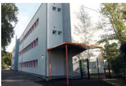
L'entrée principale a été également réaménagée. Elle est désormais équipée d'un auvent très pratique les jours de pluie.