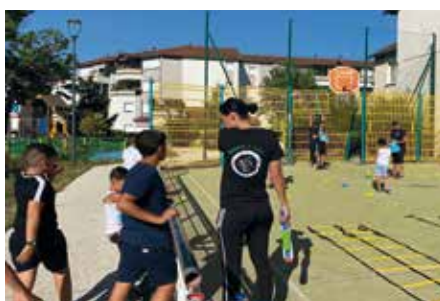
SE DÉPENSER &gt; Activités sportives à Taillefer