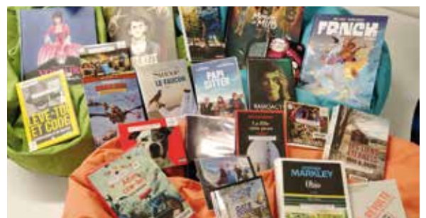
Une sélection d'ouvrages renouvelée régulièrement

Livres, films, musique... La bibliothèque Aragon regorge de petits et