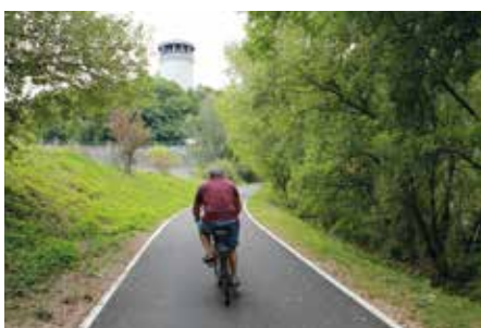
RETROUVER LA NATURE &gt; Balade le long du Drac