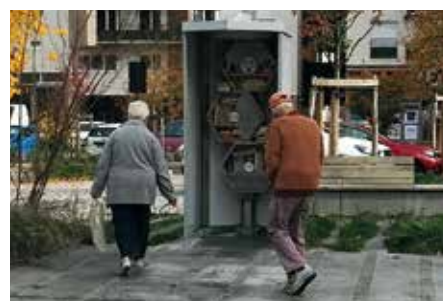
SE CULTIVER &gt; Boîtes à livres, place S. Allende