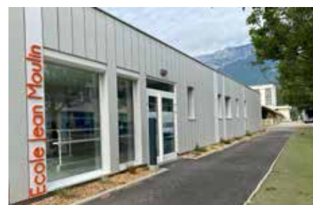
Les travaux actuels succèdent à ceux réalisés l'an dernier avec la construction et l'aménagement d'un self pour la restauration scolaire.