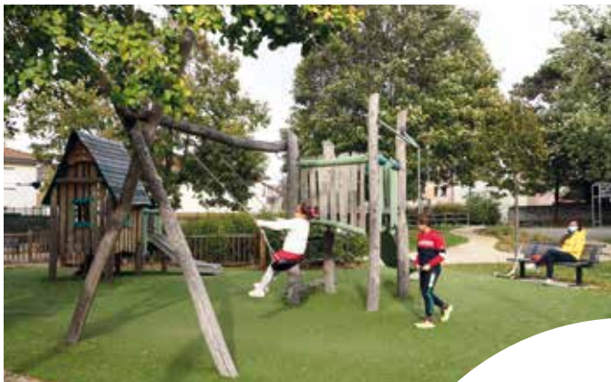
JOUER &gt; Square de l'Ancien lavoir