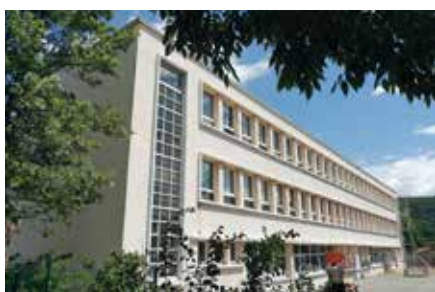
Vue du bâtiment avant les travaux. Construit en 1969, il a connu des améliorations au fil des décennies mais n'avait jamais connu une telle transformation.