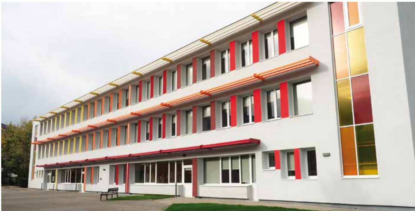
Vue de l'école depuis la cours. La façade a été isolée par l'extérieur et repeinte avec des touches de couleurs acidulées.

Un chantier d'importance s'achève en cette fin d'année au groupe scolaire Jean Moulin avec des travaux sur le bâtiment et les locaux accueillant les classes de niveau élémentaire (du CP au CM2).