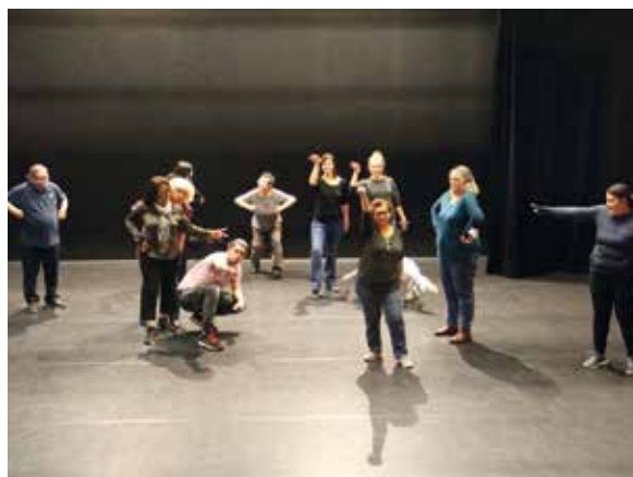
Les acteurs prêts à s'envoler