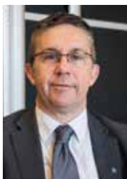
CHRISTOPHE FERRARI MAIRE DE PONT DE CLAIX PRÉSIDENT DE GRENOBLE-ALPES MÉTROPOLE